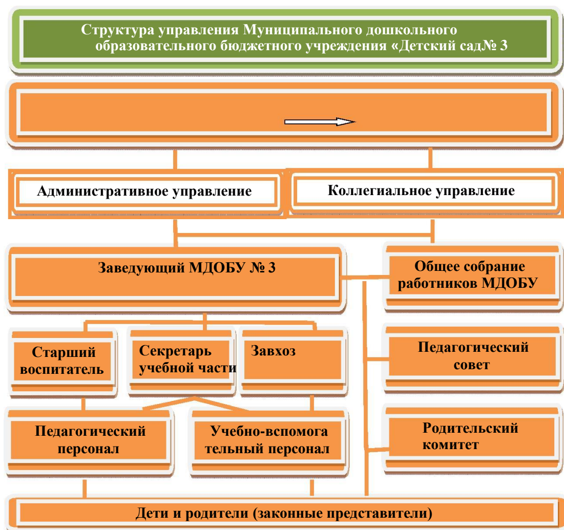
Органы управления, действующие в МДОБУ

Основными принципами управления развитием МБДОУ являются: принципы ориентации на человека и его потребности, аналитико-прогностической направленности управления, системности управления, деятельностного подхода.